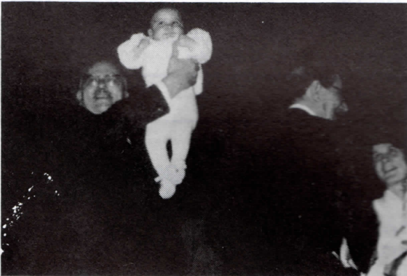
le 10000 e habitant!